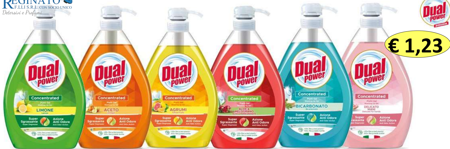
254068 - 254069 - 254070 - 254072 - 254073 - 254074 PIATTI CONCENTRATO DOSATORE LT.1