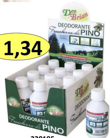
220195 DEOD. BRIAN PROFUMA THERMO ML.125 FRESCHEZZA PINO