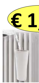
501232 - 501233 SONDA EVAPORATORE